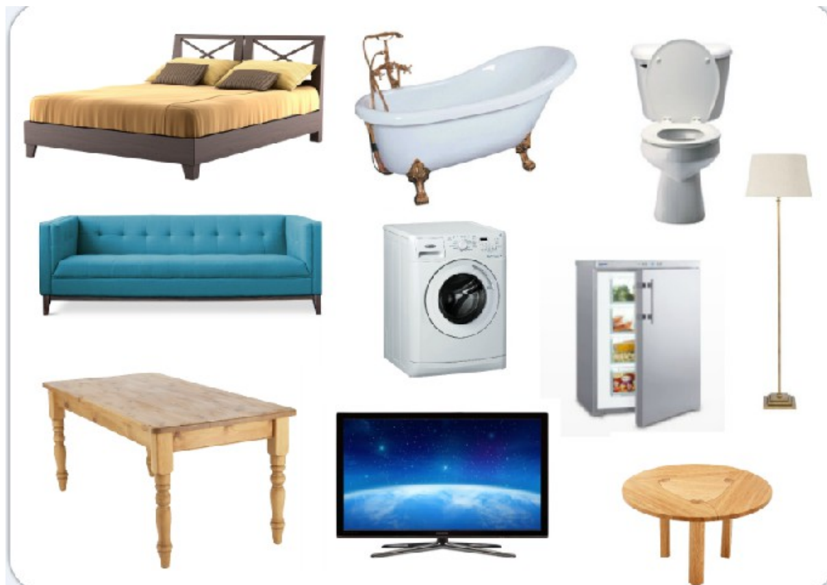
Table – stół